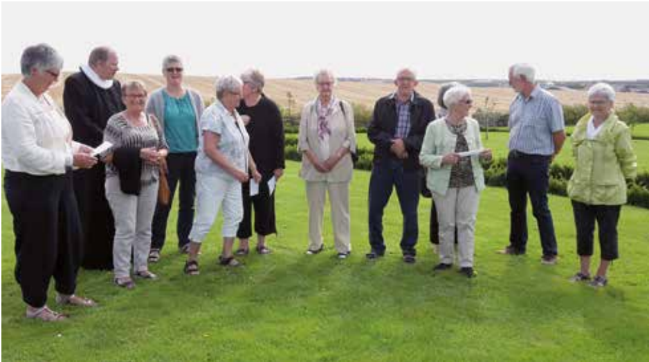
Indvielse af det nye kirkegårdsareal søndag den 30. august.