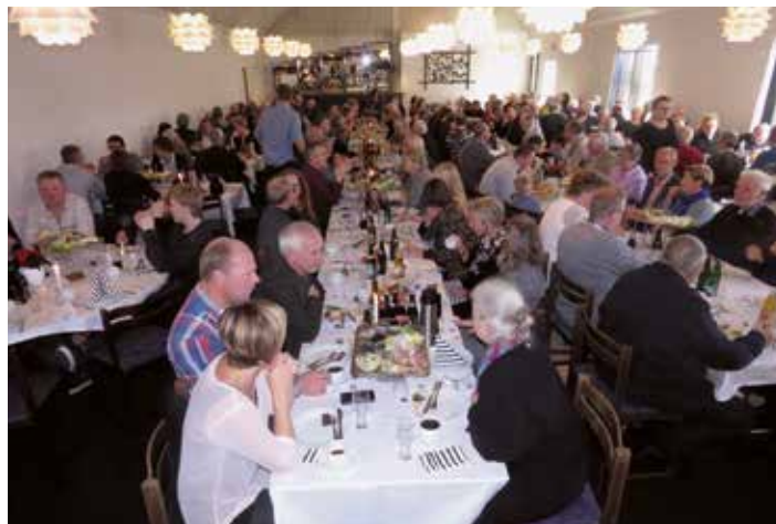
Fra den efterfølgende frokost på Thinguskroen.