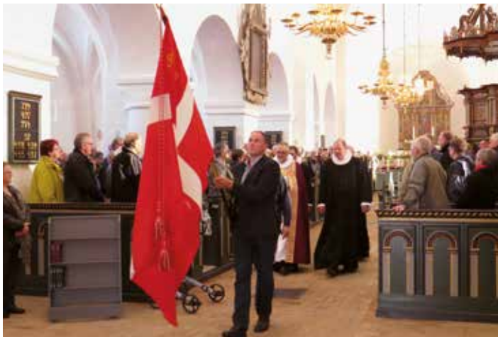
Fanen bæres ud.