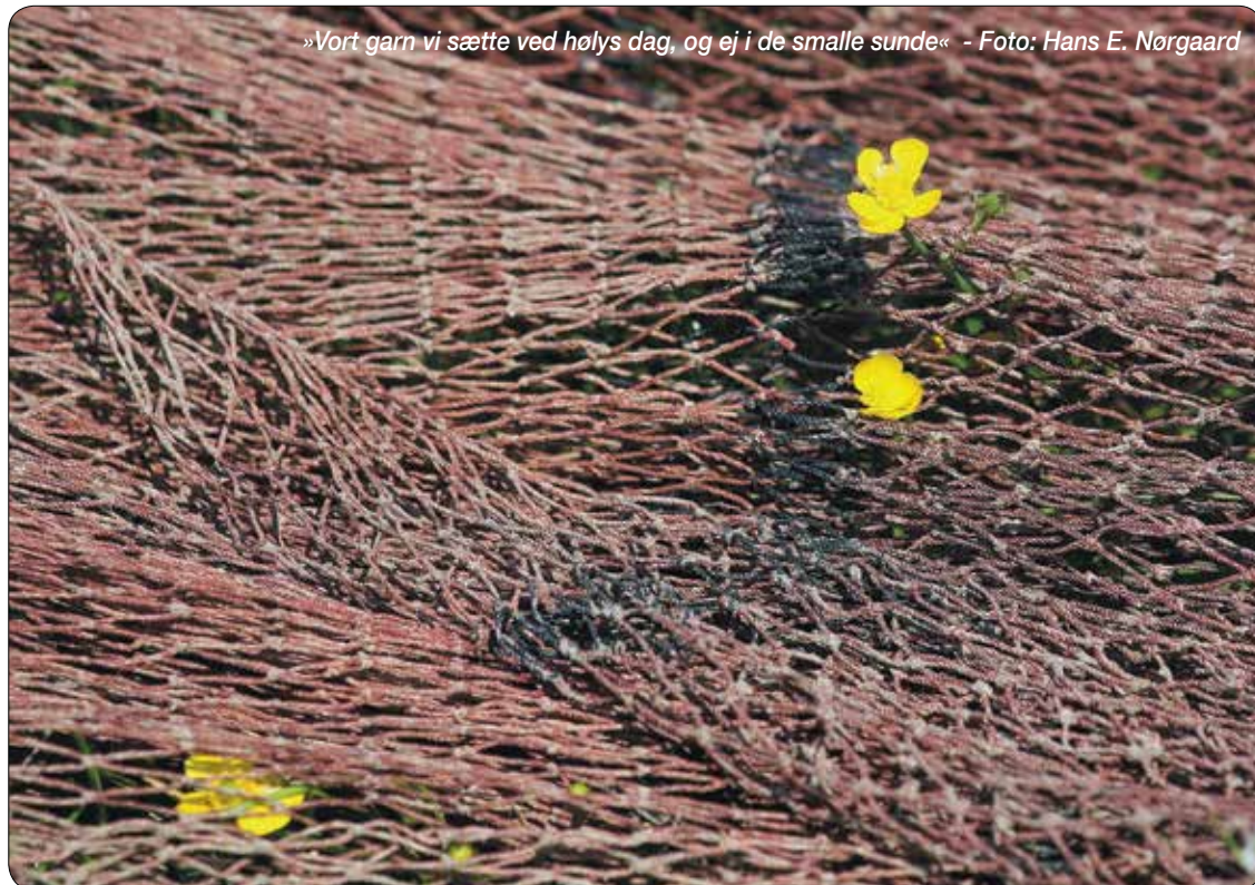
»Vort garn vi sætte ved hølvs dag, og ej i de smalle sunde«