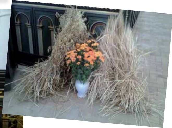
Årets høstgudstjeneste i Vestervig Kirke.