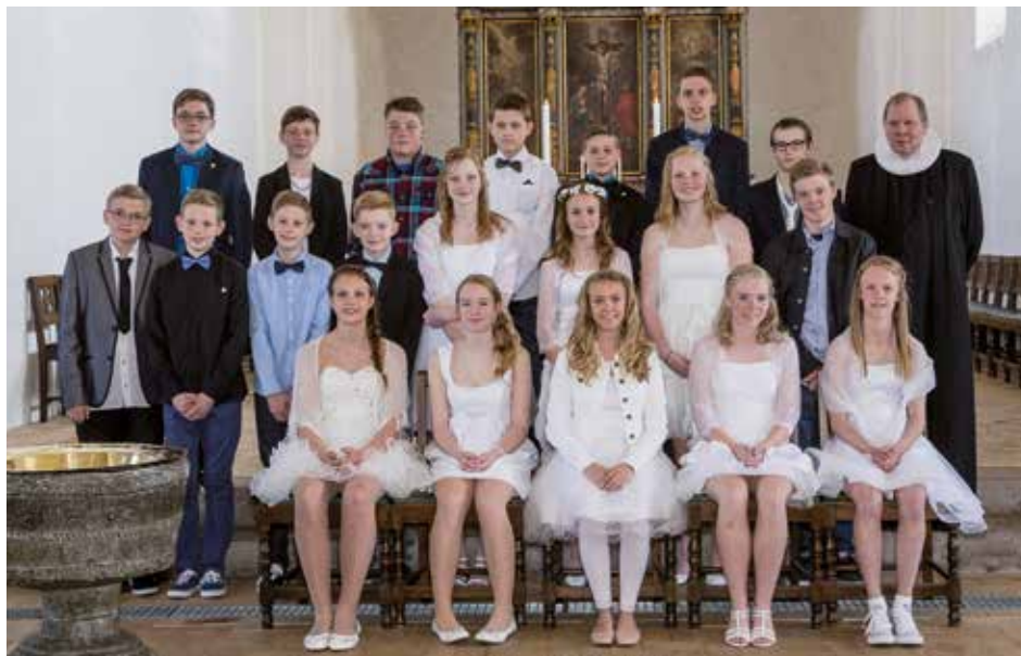
Vestervig Kirke 18. maj.