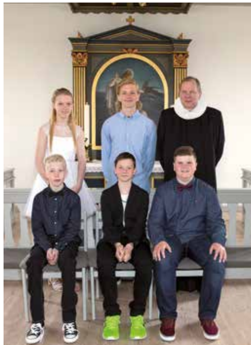
Agger Kirke 16. maj