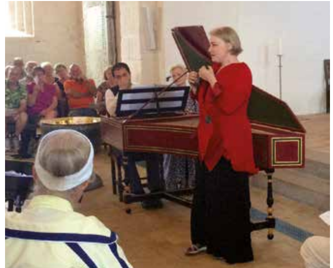
Sommerkoncert ved Michala Petri.