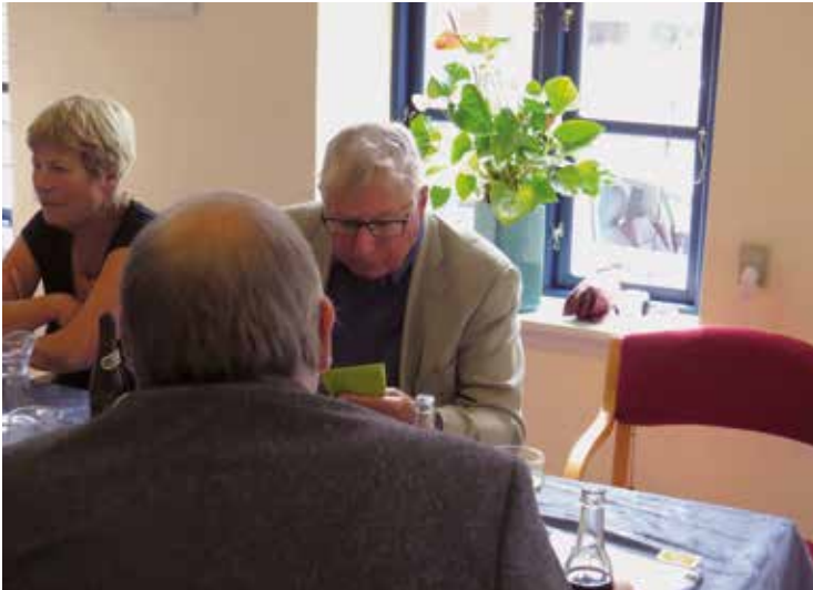
Frokost i sognehuset.